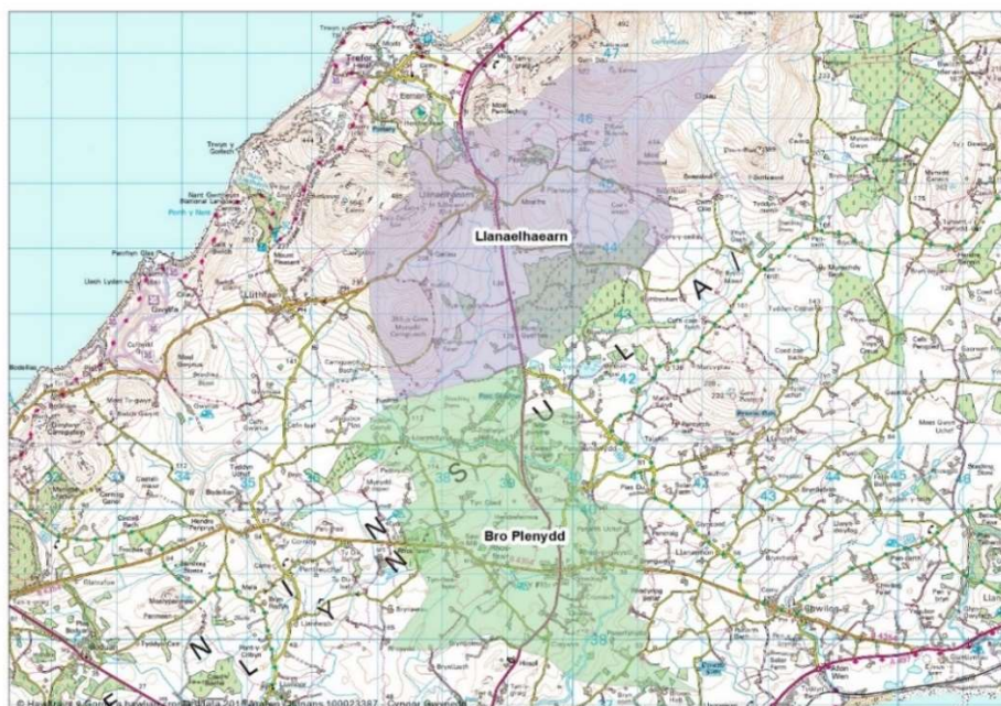
Map 2: Dalgylch Ysgol Bro Plenydd os fydd newid